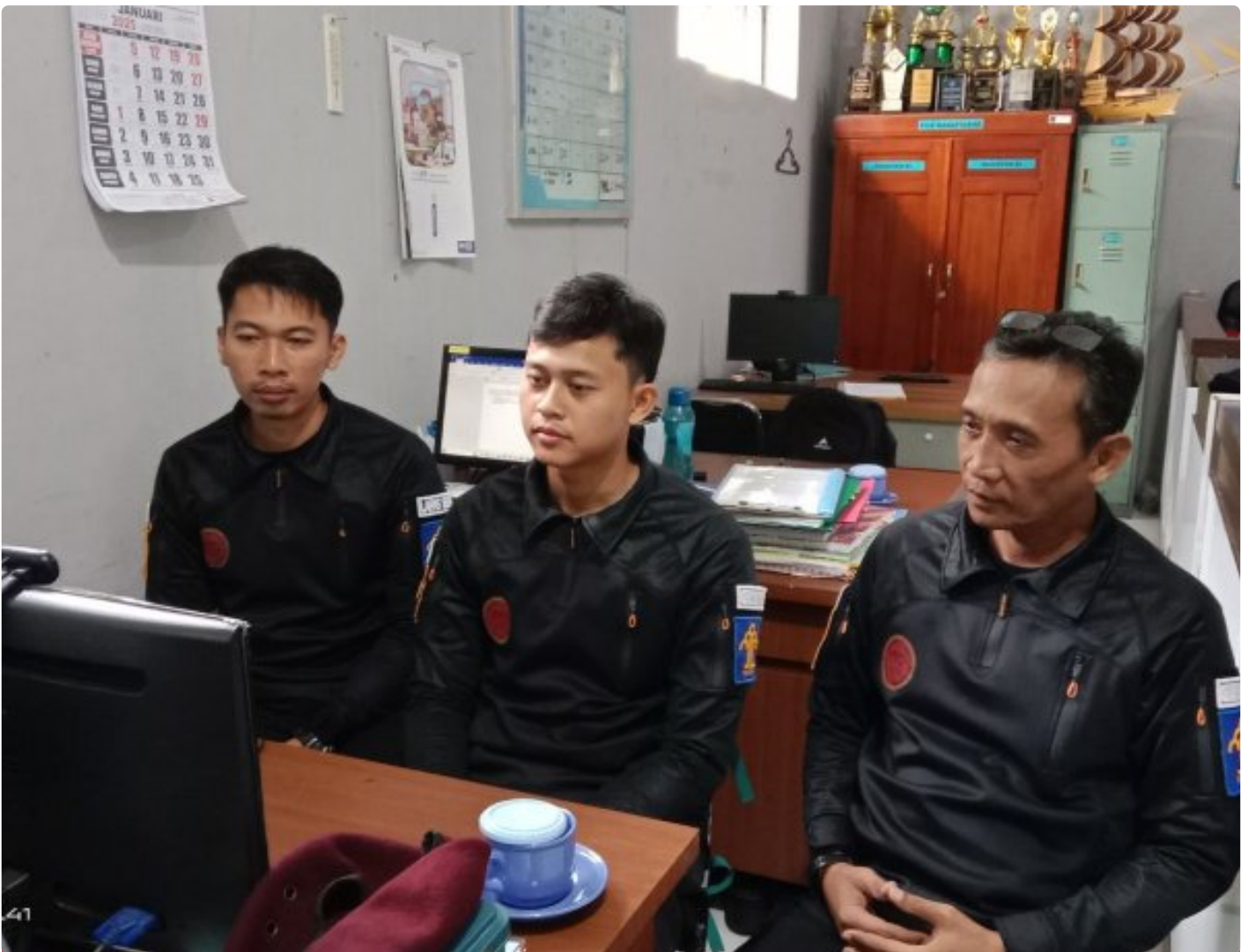
Bangun Harmoni dan Strategi, Lapas Besi Ikuti Webinar Refleksi Akhir Tahun 2024 & Resolusi 2025

CILACAP – Sebagai salah satu langkah dalam pengembangan kompetensi bagi Aparatur Sipil Negara (ASN), Petugas Lembaga Pemasyarakatan Kelas IIA Besi